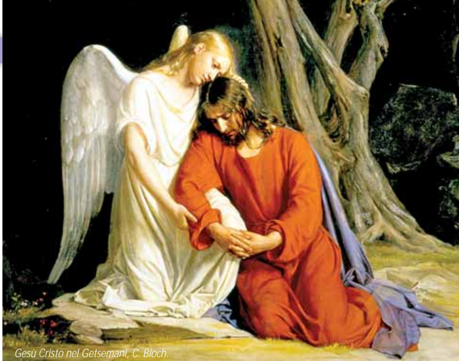
Gesù Cristo nel Getsemani, C. Bloch.

Vogliamo soffermarci ancora un momento sulla preghiera per comprendere meglio cosa essa sia. La preghiera è dono, non c'è un metodo di pregare ma ognuno deve trovare il proprio modo per parlare all'Amato; l'uomo è reso capace della relazione con Dio perché è fatto a «immagine e somiglianza di Dio» (cfr. Gen 1,27). La preghiera è umiltà, l'umile mette al centro Dio; la preghiera è questo lasciarsi guardare da Lui per capire e comprendere chi sono veramente io.