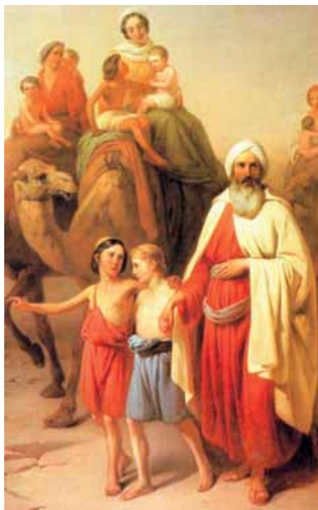
Viaggio a Canaan (dettaglio), J. Molnar.

Vi esorto a non arrendervi mai come Dio per noi non si arrende mai; lui non ci molla mai anche quando noi gli chiudiamo le nostre porte; lui non ci rifiuta mai il suo sguardo anche se il nostro volto è macchiato dal nostro peccato, lui non smette di tendere la sua